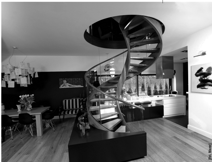
Schody spiralne to efektowne wizualnie rozwiązanie, sprawdzające się szczególnie w niewielkich wnętrzach.